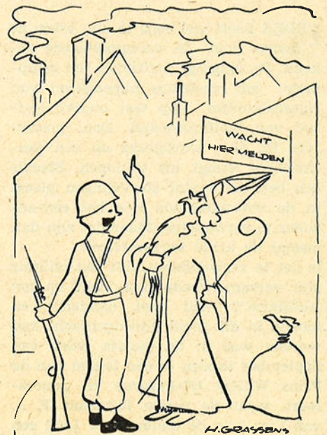
HET SPJDT ME MAAR U MOET DE HIERARCHIEKE WEG BEWANDELEN