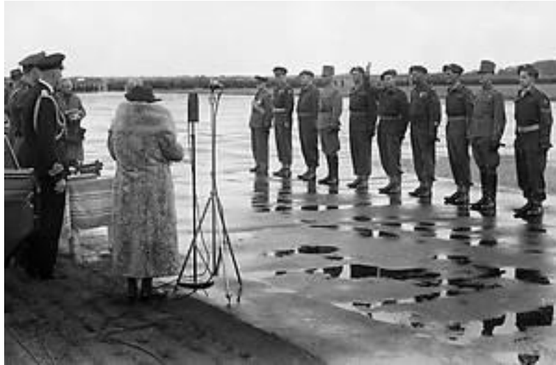
Koningin Wilhelmina presenteert de Bronzen Leeuw aan voormalige BBO Agenten.