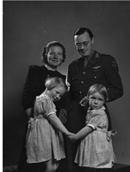
Koninklijke familie in Ottawa, Canada op 4 mei, 1942