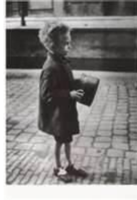
Tijdens de Hongerwinter van 1944/45 stierven zo'n 20.000 Nederlanders van de honger of vrozen dood.